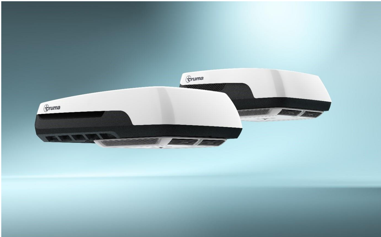
BU: A 2e generatie – meesterwerken van coolheid (links: Aventa comfort 2e generatie, rechts: Aventa compact 2e generatie)

De Truma-dakairco's uit de Aventa-serie behoren tot de populairste airconditioningsystemen onder camperbezitters en bestelwagenliefhebbers. Ze bieden immers te allen tijde de perfecte comfortabele temperatuur in het voertuig en hebben sinds hun marktintroductie bewezen flexibel, zuinig en efficiënt te zijn in het dagelijkse verkeer. Nu volgen met de 2e generatie Aventa-modellen echte coole meesterwerken - vanaf voorjaar 2025 verkrijgbaar in de speciaalzaak.